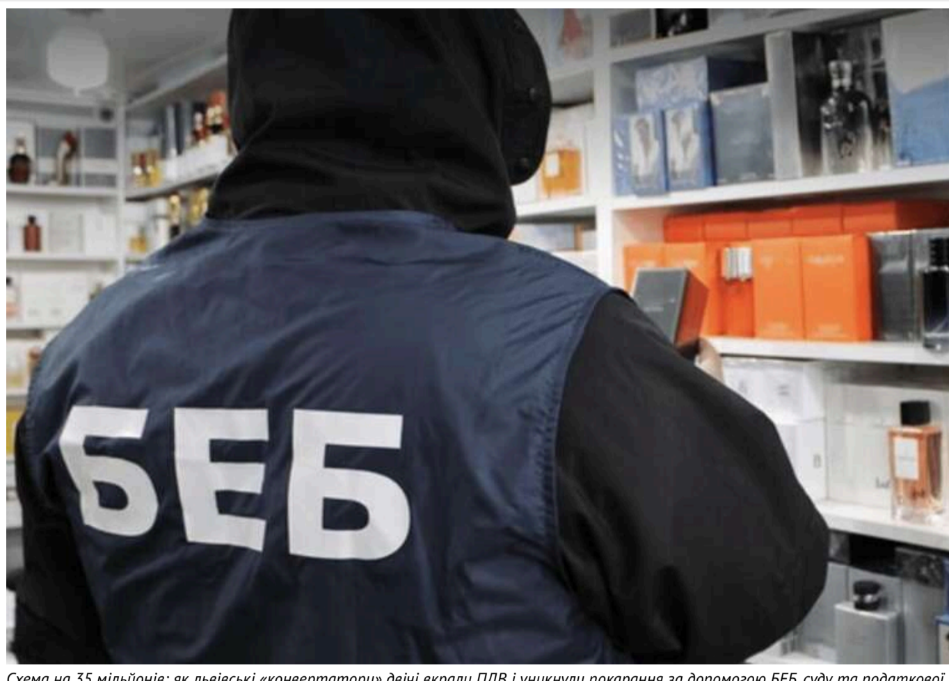
Схема на 35 мільйонів: як львівські «конвертатори» двічі вкрали ПДВ і уникнули покарання за допомогою БЕБ, суду та податкової

Читати на руськом Read in English Додати як бажане джерело в Google