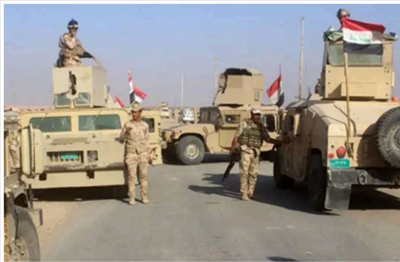
Reuters: ІДІЛ активізується і готується до повернення в Сирію та Ірак – розвідки фіксують зростання загрози

Понад 20 джерел Reuters, включаючи представників силових структур та політичних кіл Сирії, Іраку, США та Європи, повідомляють, що ІДІЛ відновлює діяльність бойовиків, плануючи повернення до Сирії та Іраку.