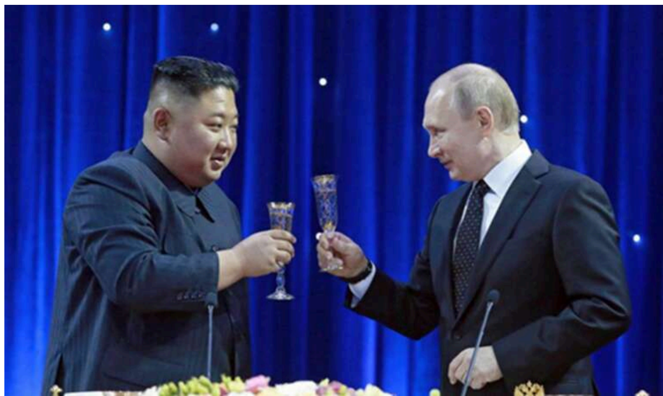
Кім Чен Ин пообіцяв Путіну завжди підтримувати Росію

Лідер Північної Кореї Кім Чен Ин у привітальному посланні президенту Росії Володимиру Путіну з нагоди Дня Росії підтвердив незмінну підтримку Пхеньяном Москви. Він висловив готовність зміцнювати двосторонні відносини, назвавши їх "справжніми відносинами соратників" і підкресливши свою особисту відданість поглибленню партнерства з Росією.