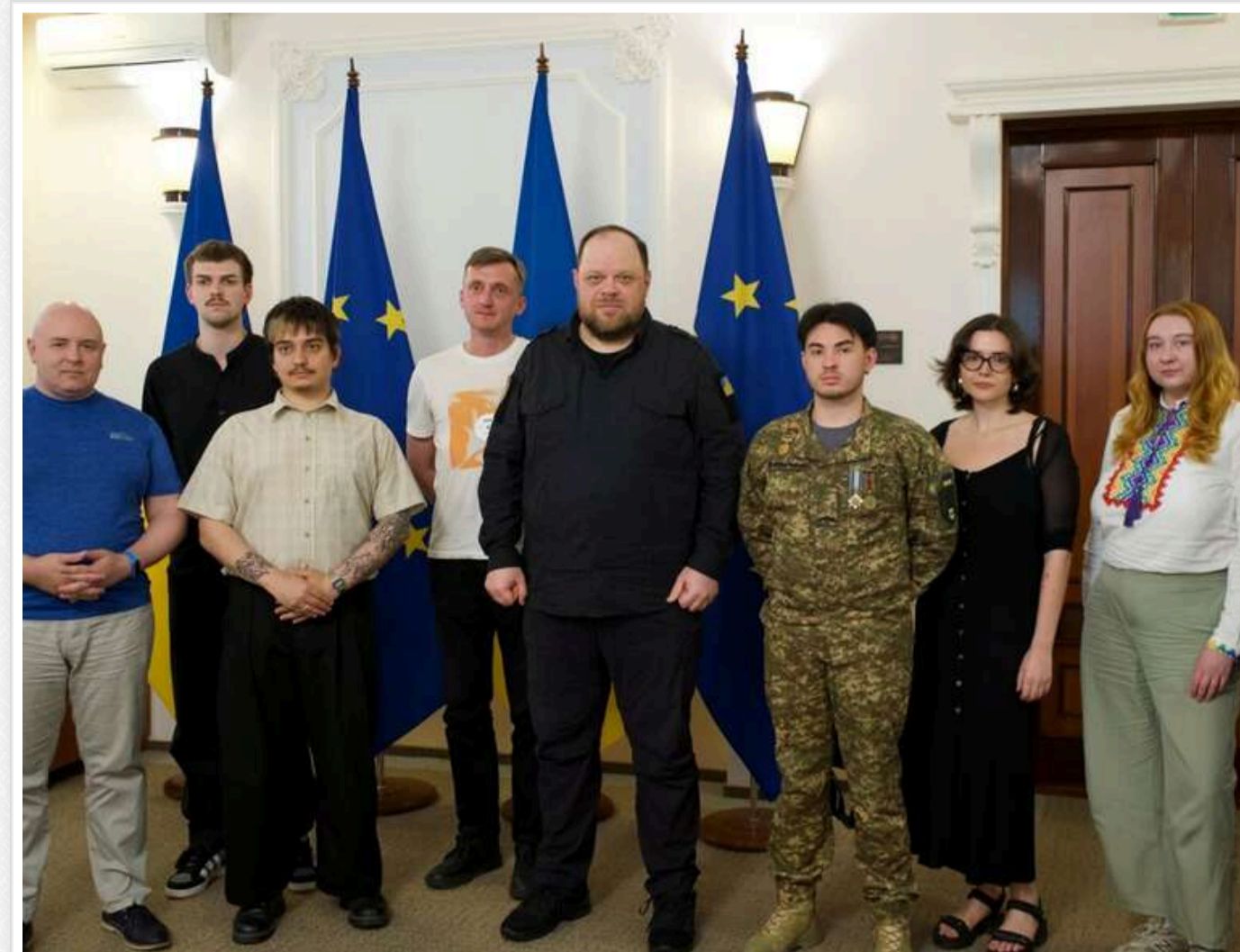
Чинне визначення сім'ї залишать без змін: Стефанчук обговорив із ЛГБТК+ спільнотою правки до проєкту нового Цивільного кодексу

Голова Верховної Ради Руслан Стефанчук провів зустріч із представниками та представницями ЛГБТК+ спільноти. Метою зустрічі стало обговорення проєкту нового Цивільного кодексу та пропозицій щодо його доопрацювання.