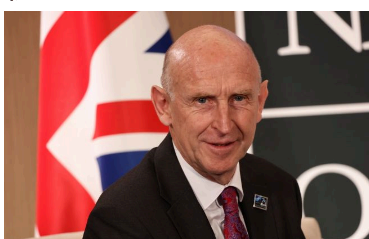
Фото: колишній міністр оборони Великої Британії Джон Гілі (Getty Images)