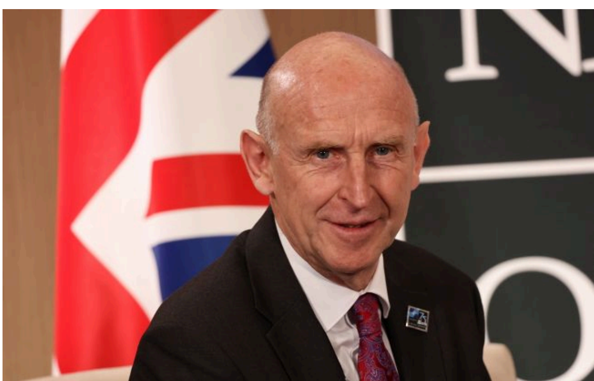
Фото: колишній міністр оборони Великої Британії Джон Гілі