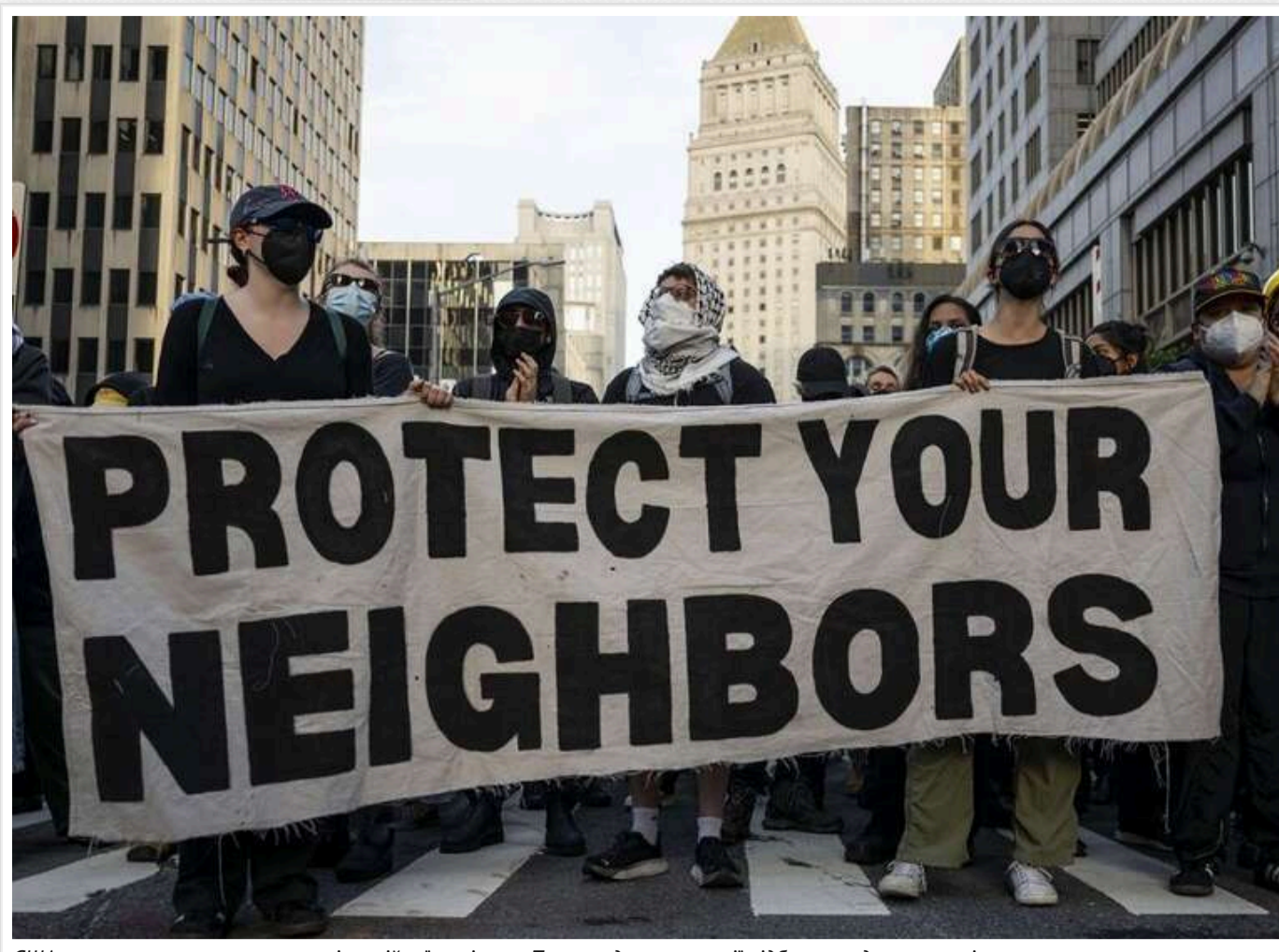
США охопили протести проти міграційної політики Трампа: демонстрації відбулися в десятках міст

Читати на руськом Додати як бажане джерело в Google