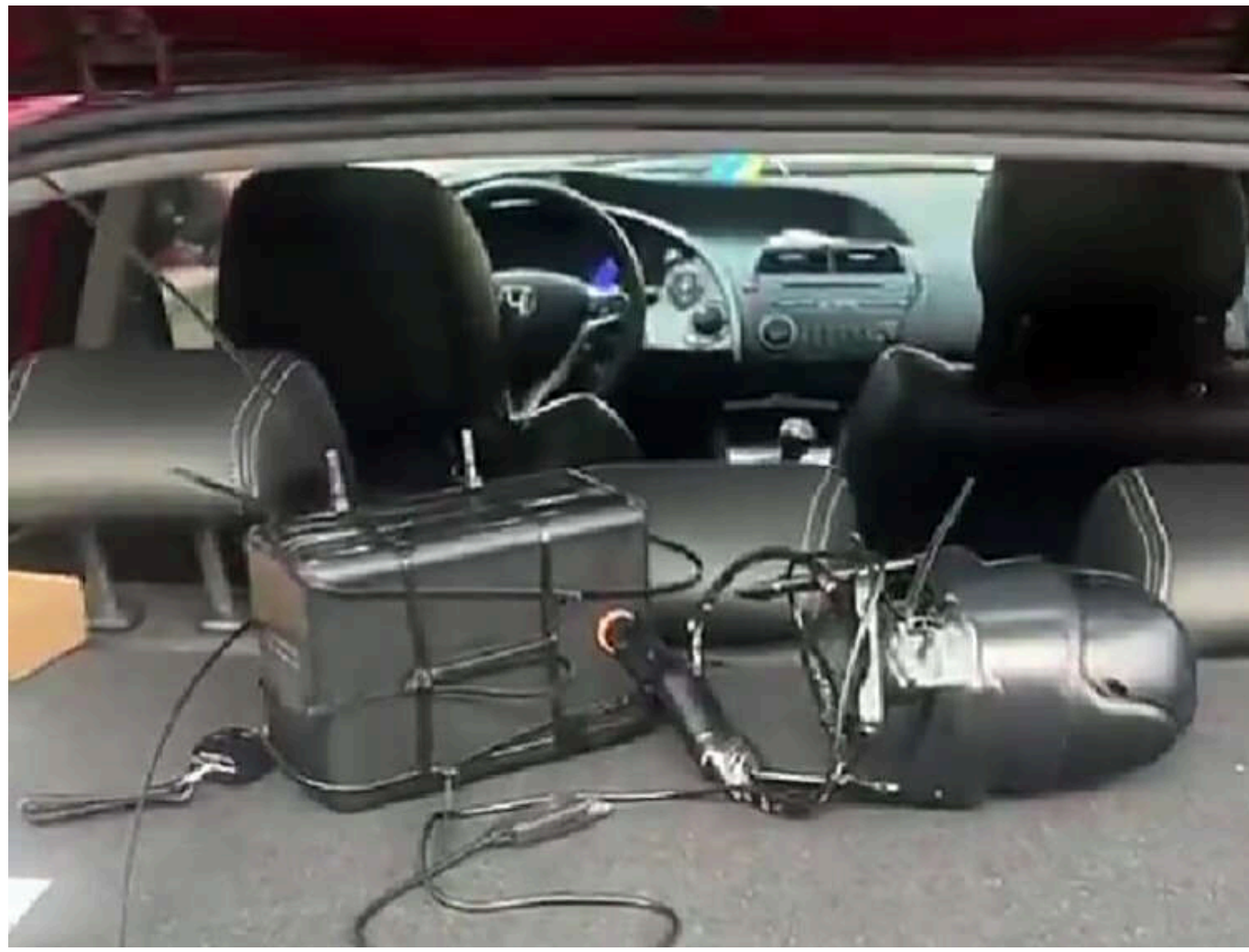
У Києві готується захоплення Жовтневого палацу? Біля будівлі виявили "шпигунську" автівку

Читати на руськом Read in English Додати як бажане джерело в Google