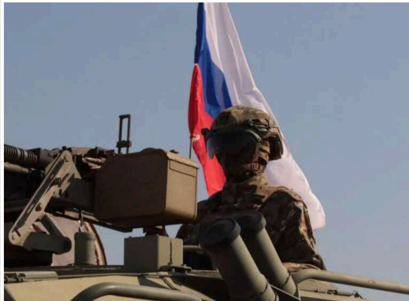
Росіяни просунулися до кордону Дніпропетровщини на новій ділянці, - військовий "Мучной"

Читати на руськом Read in English Додати як бажане джерело в Google