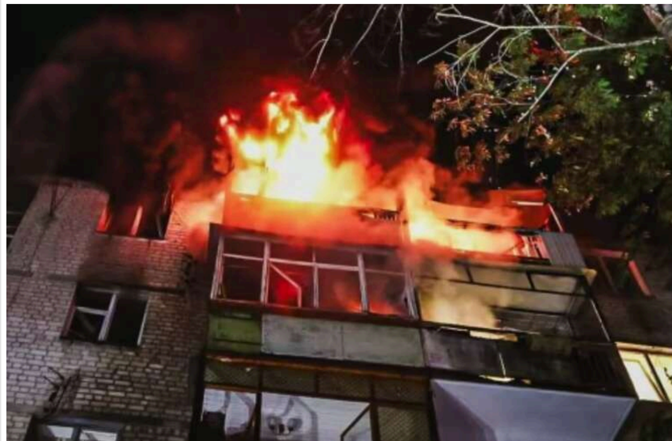
Кількість жертв російської атаки по Харкову зросла до чотирьох

Читати на руськом Read in English Додати як бажане джерело в Google