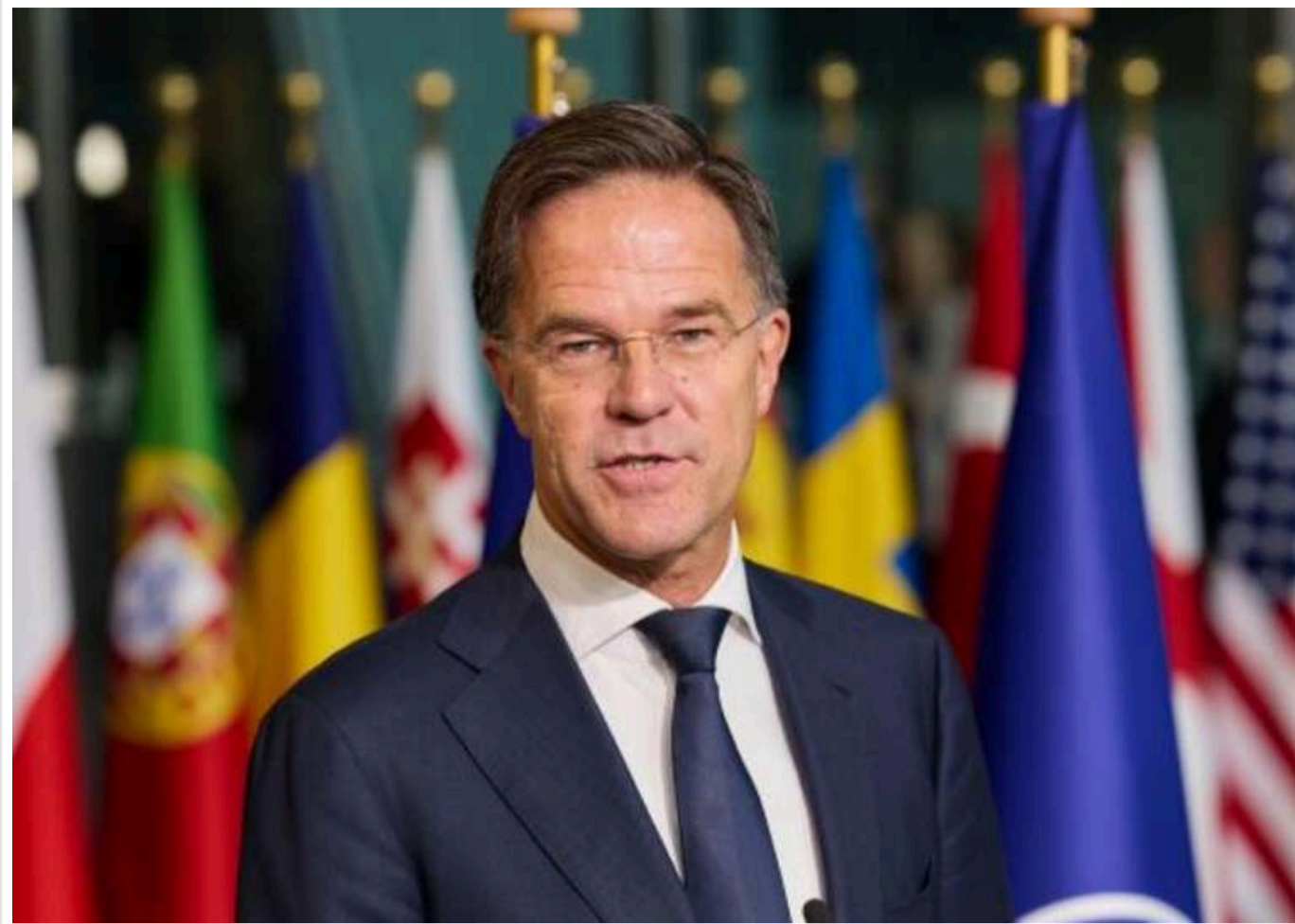
Рютте вирушить до Риму для участі у зустрічі у форматі «Веймар плюс»

Цього тижня генеральний секретар НАТО Марк Рютте відвідає Італію, щоб взяти участь у зустрічі формату "Веймар плюс".