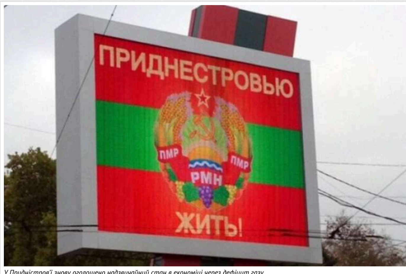
У Придністров'ї знову оголошено надзвичайний стан в економіці через дефіцит газу

У невідомому Придністров'ї на 30 днів запровадили надзвичайний стан в економіці, оголосивши про скорочення постачання природного газу в регіон.