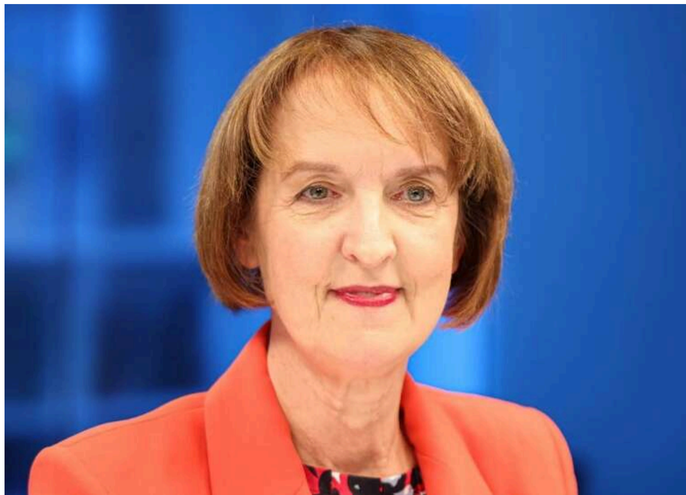
Міністр Латвії Інґа Берзіня подала у відставку через технічні збої на муніципальних виборах

Міністерка з питань розумного управління та регіонального розвитку Латвії Інґа Берзіня склала з себе повноваження через технічні проблеми під час муніципальних виборів.