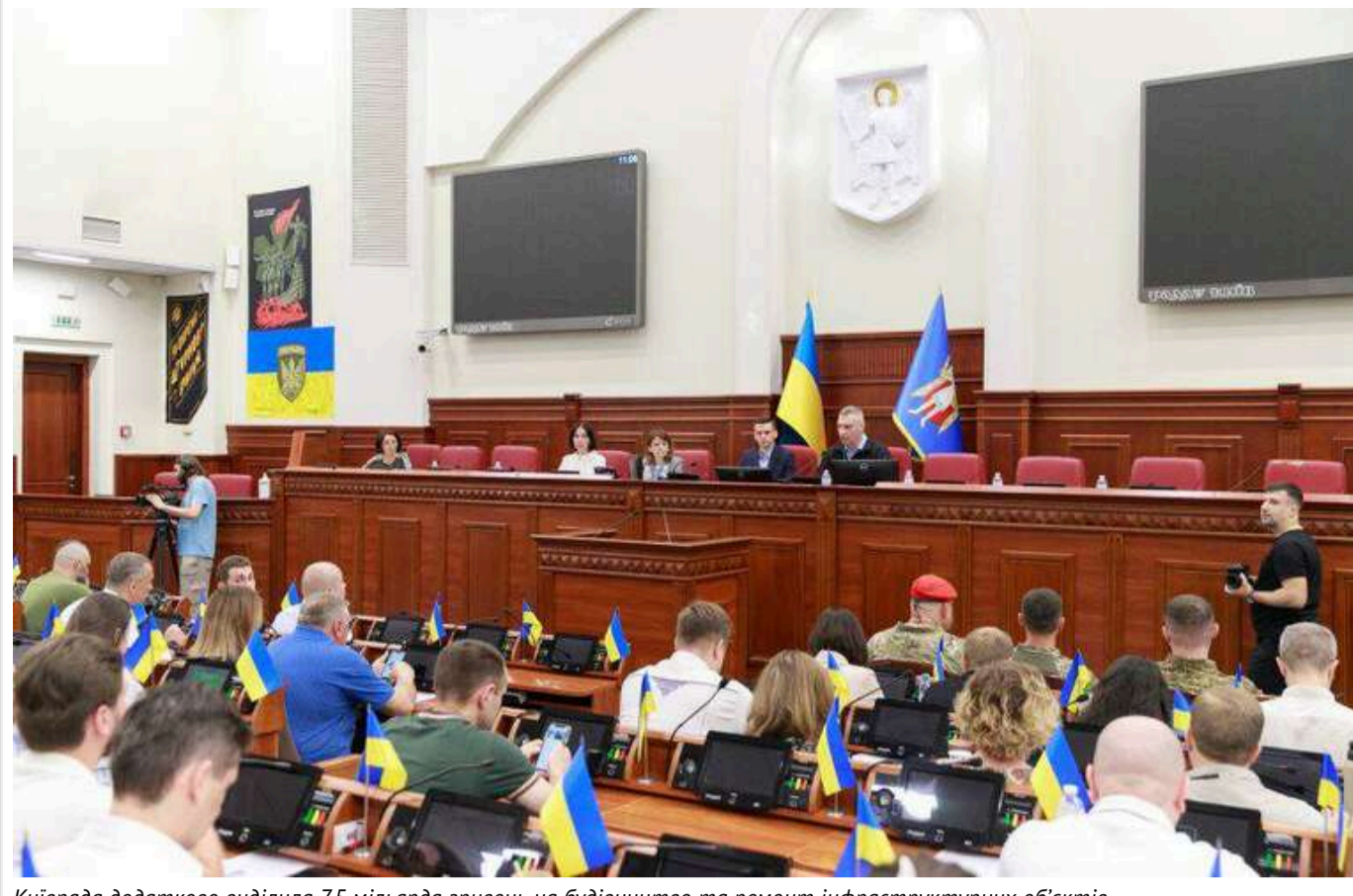
Київрада додатково виділила 7,5 мільярда гривень на будівництво та ремонт інфраструктурних об'єктів

Читати на руськом Read in English Додати як бажане джерело в Google