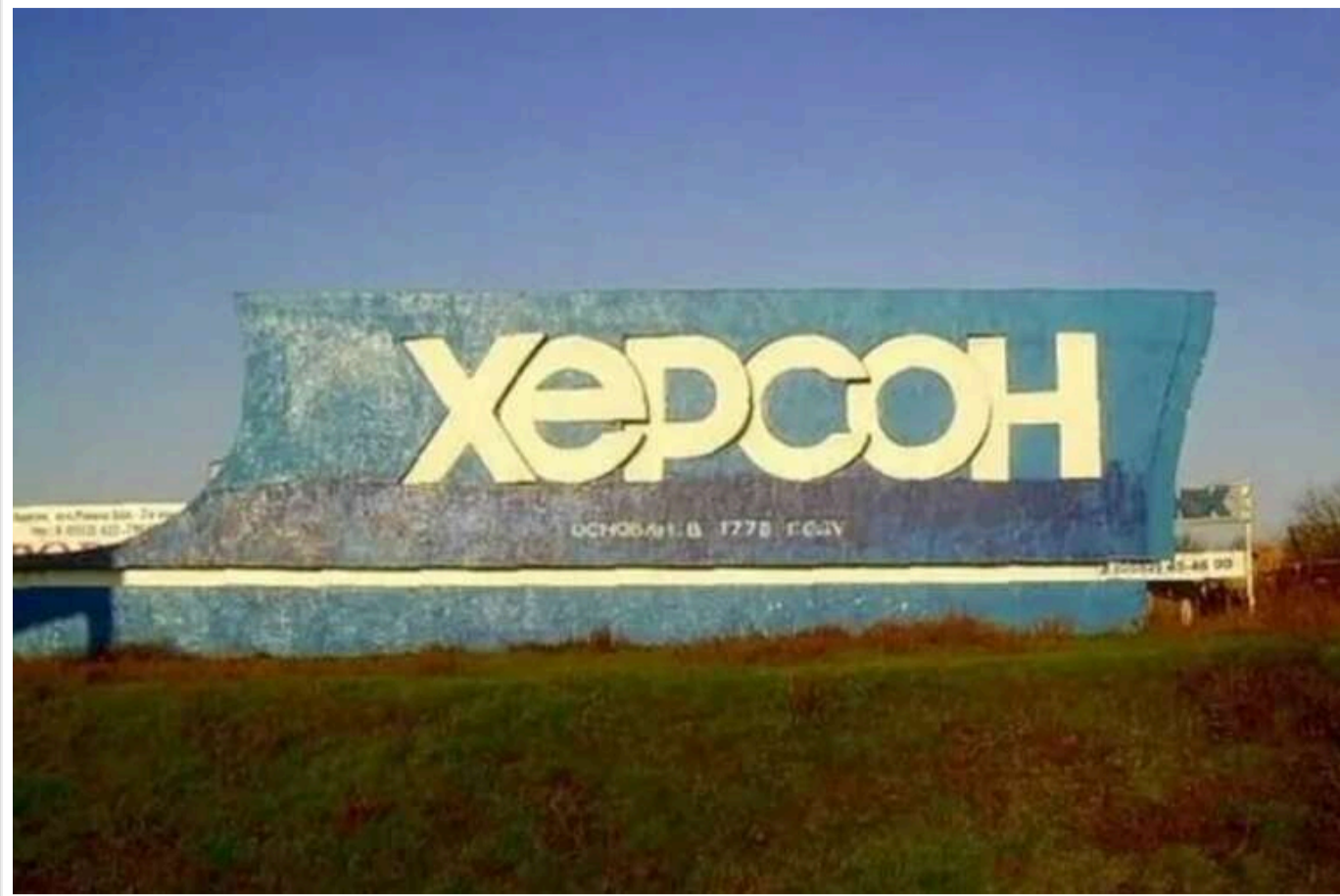
Росіяни атакували дроном комунальників у Херсоні: двоє постраждалих

Читати на руськом Read in English Додати як бажане джерело в Google