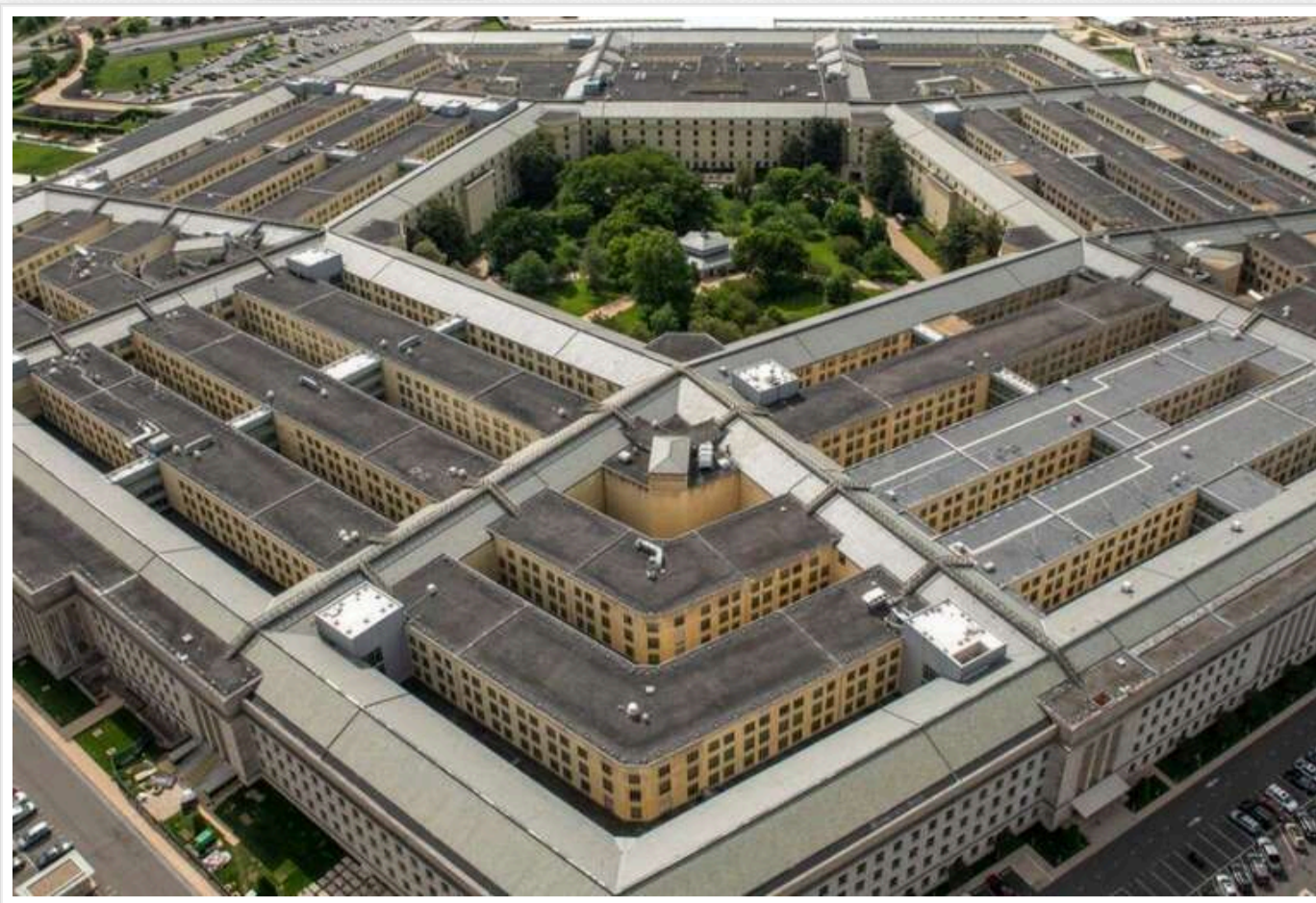
Пентагон звільнив помічників Геґсета через неправдиві твердження колишнього чиновника DOGE, - ЗМІ

Читати на руськом Додати як бажане джерело в Google