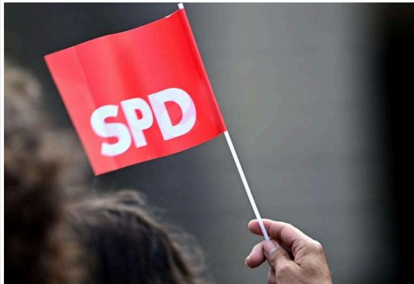
У СДПН закликали Німеччину до переговорів із РФ і розкритикували зростання військових витрат

Кілька десятків впливових членів Соціал-демократичної партії Німеччини (СДПН), яка входить до керівної коаліції, виступили зі спільним маніфестом. У ньому вони закликали владу країни розпочати переговори з Росією та розкритикували нинішній курс на збільшення військових витрат, повідомляє видання Stern.