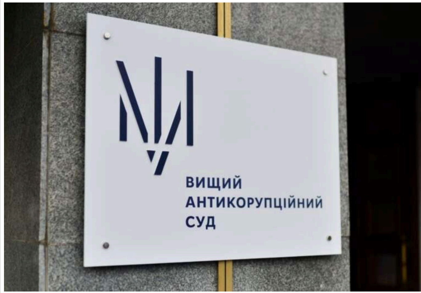
ВАКС засудив ексзаступника начальника поліції Сумщини та адвоката за хабарництво

Читати на руськом Read in English Додати як бажане джерело в Google