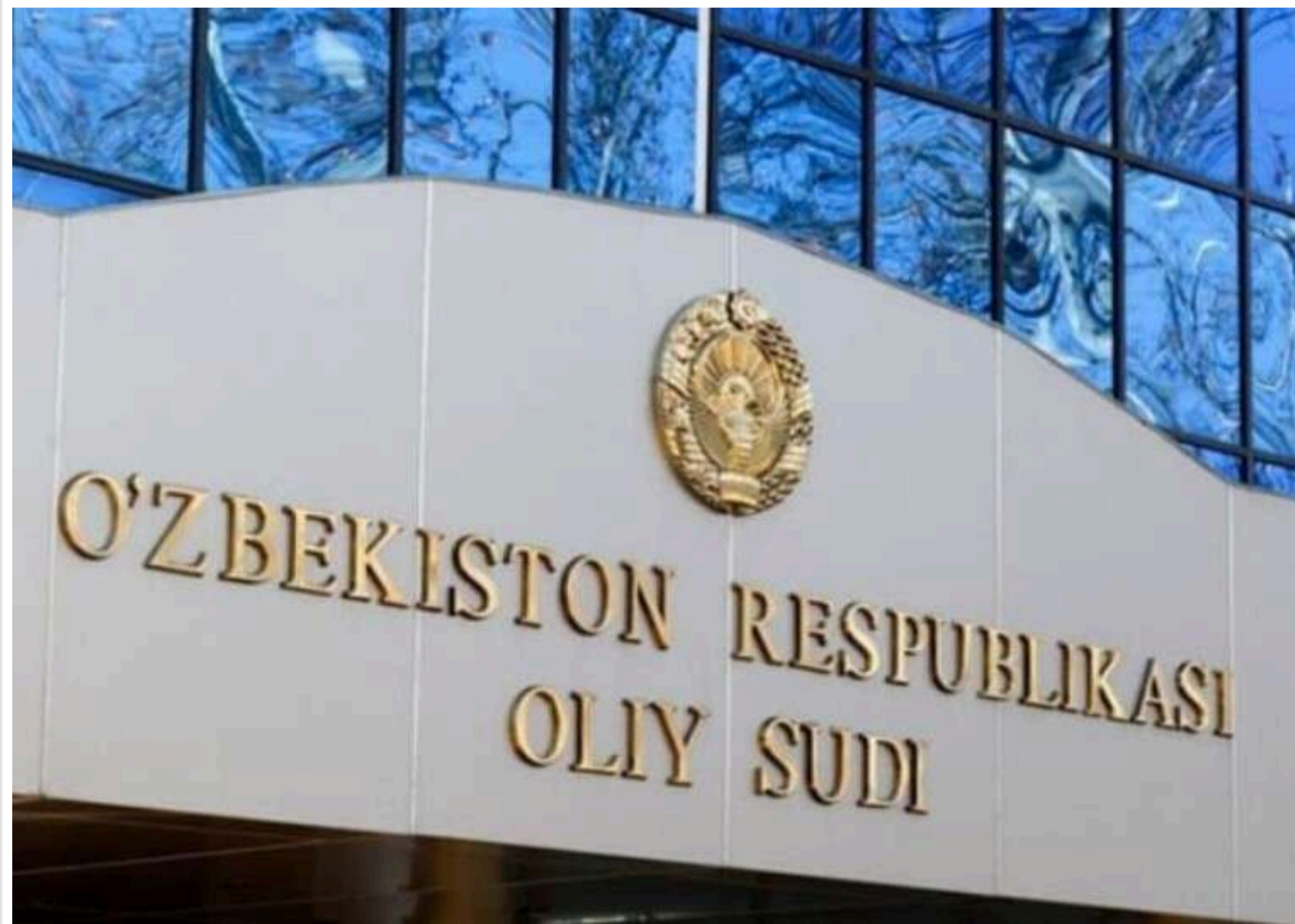
В Узбекистані винесли вирок чоловікові, який у складі ПВК «Вагнер» брав участь у бойових діях проти України

В Узбекистані суд виніс вирок 25-річному чоловікові, який воював на боці Росії проти України, засудивши його до п'яти років позбавлення волі за участь у найманстві.