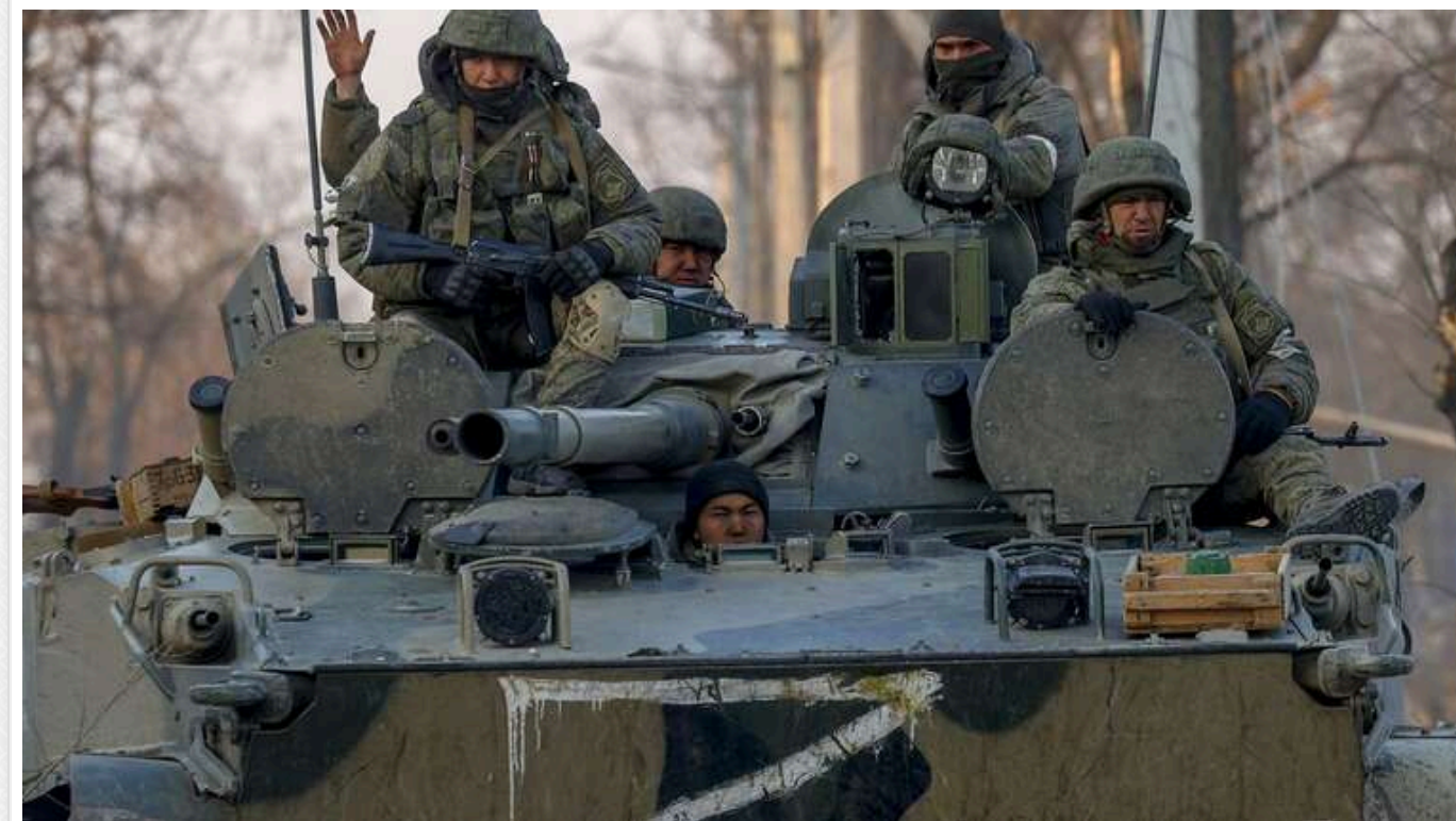
Наступ РФ на Сумщині - це рух на Київ, - нардепка Безугла

Читати на руськом Read in English Додати як бажане джерело в Google