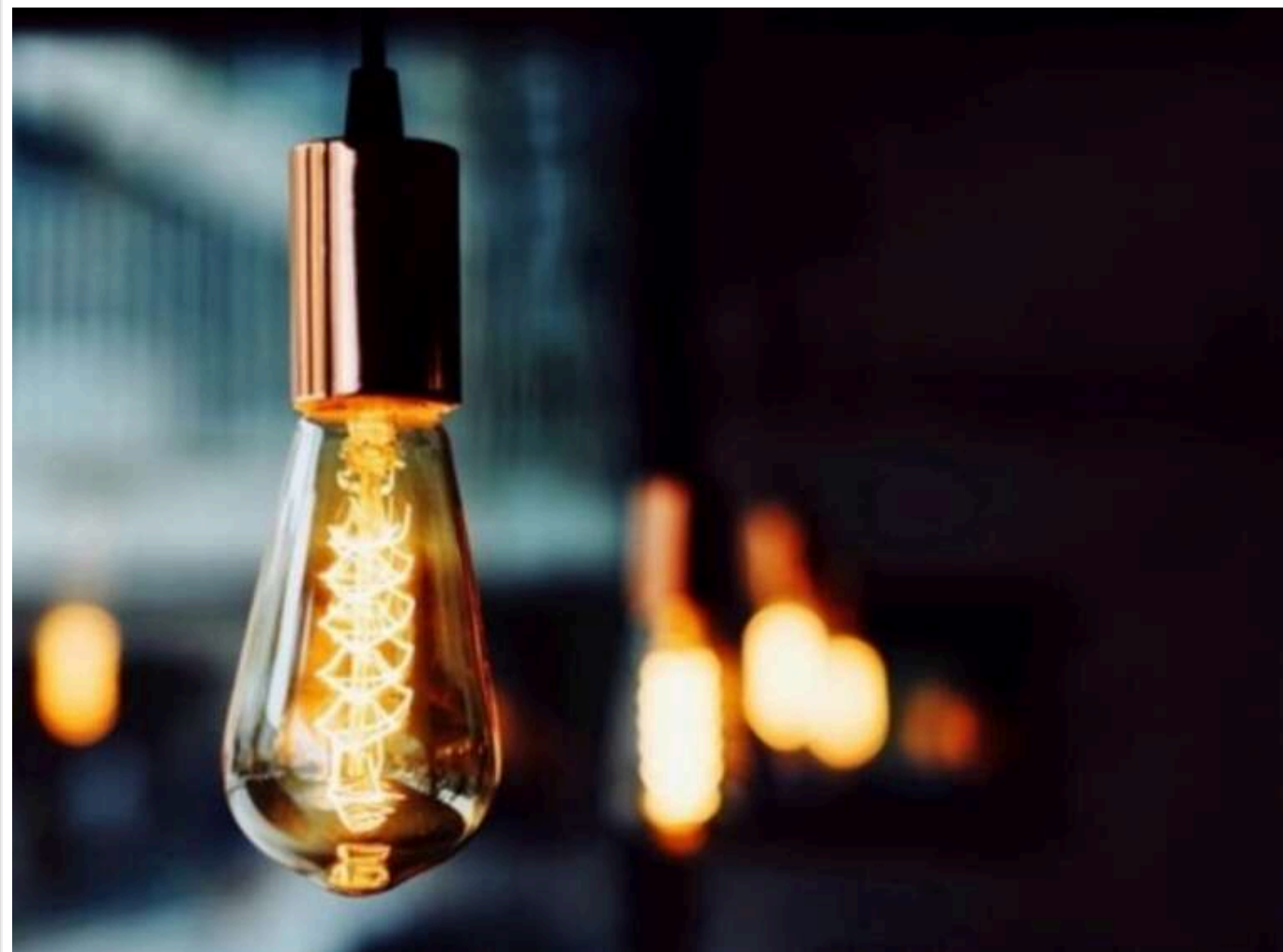
Ранковий блекаут на Півдні: Херсонська ОВА підтверджує обстріл енергооб'єкта

Ранкові перебої зі світлом у Миколаєві та Херсоні були спричинені обстрілом. Про це повідомила Херсонська ОВА.