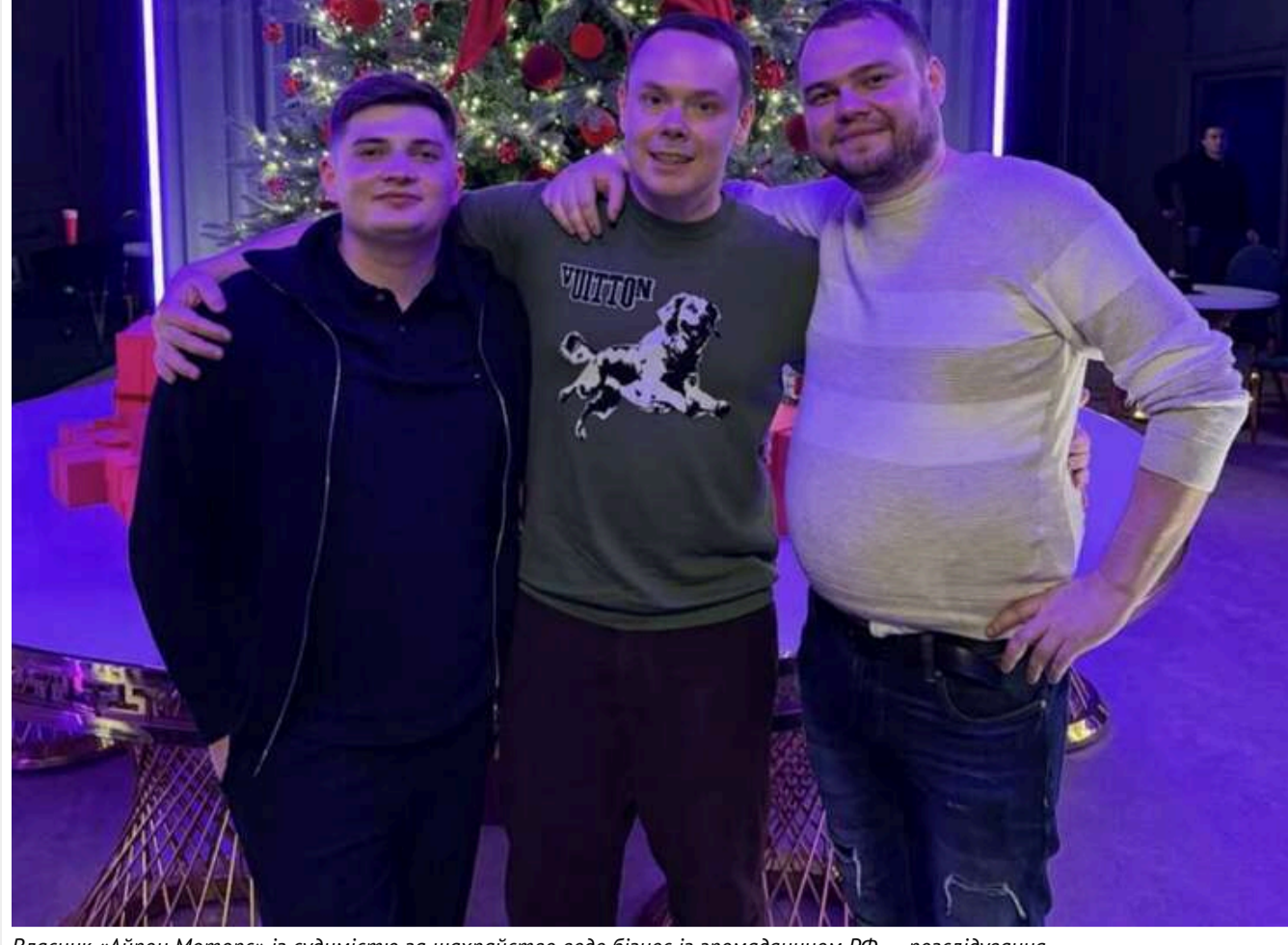
Власник «Айрон Моторс» із судимістю за шахрайство веде бізнес із громадянином РФ, – розслідування

Читати українською Read in English Додати як бажане джерело в Google