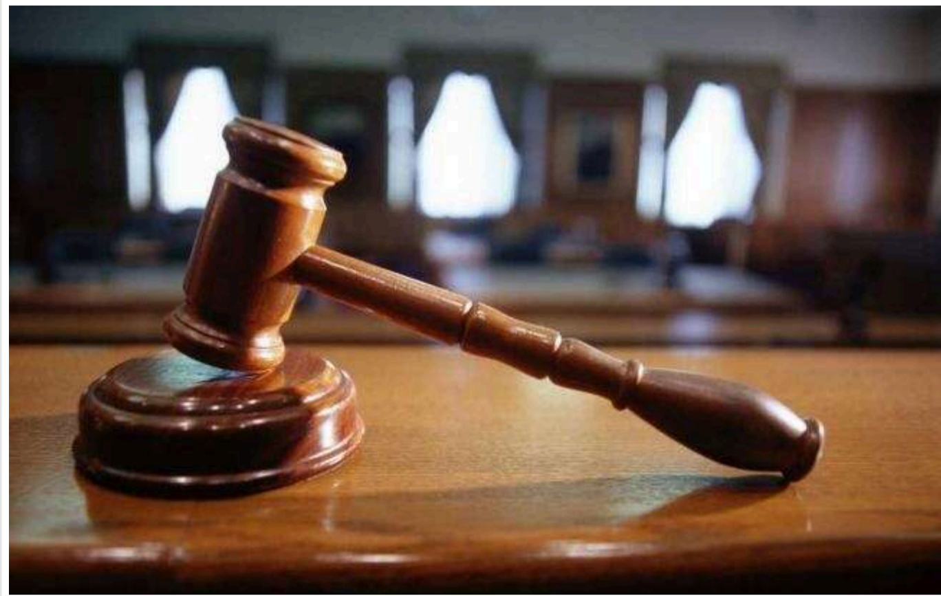
Вища рада правосуддя звільнила суддю-порушницю з Полтави: намагалася чинити тиск на іншу суддю

Читати на руськом Read in English Додати як бажане джерело в Google