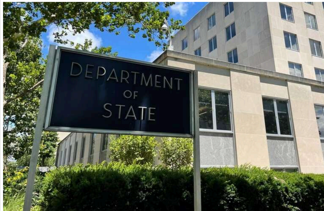
ШІ буде впливати на кар'єрне зростання дипломатів із Держдепу США

Чат-бот StateChat сприятиме вибору членів комісії, від якої залежать підвищення по службі та відрядження працівників.