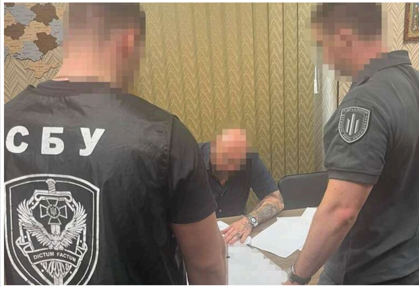
Завищив ціну більше ніж на 30%: на Дніпропетровщині затримали чоловіка, який нажився на закупівлі ліжок для ЗСУ

Читати на руськом Read in English Додати як бажане джерело в Google