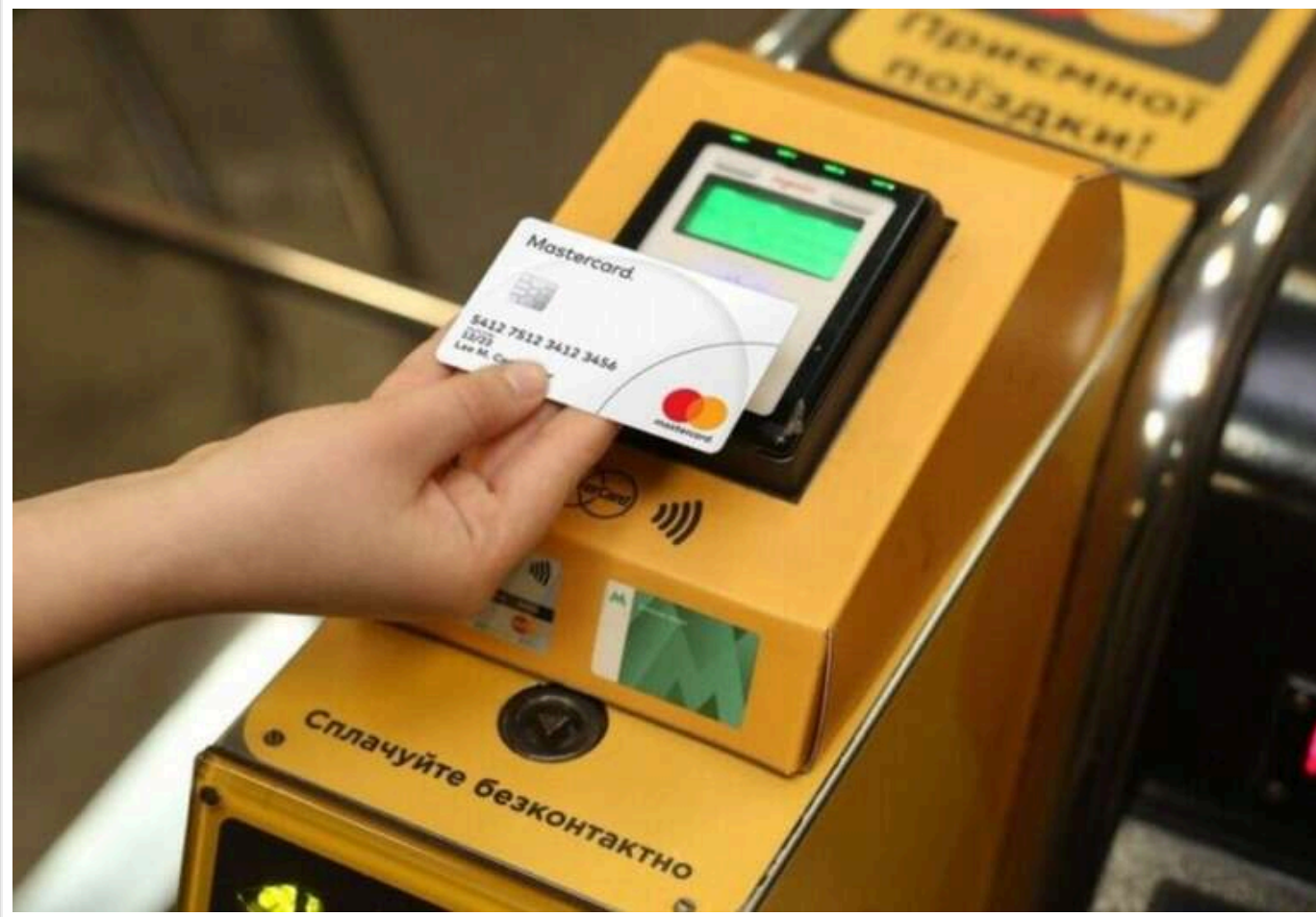
У Київському метро збої з оплатами: пасажери можуть розрахуватися картою тільки раз на добу

У Київському метро знову виникли проблеми з безконтактною оплатою. Що відбувається та коли проблема буде вирішена, не знають не лише пасажери, але й, здається, самі співробітники підземки. На турнікетах недоступна оплата проїзду банківською картою більше одного разу на день, що, звісно, дуже незручно для активних користувачів метрополітенем.