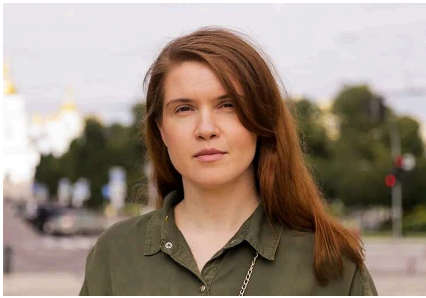
Нардеп Безугла після чергової атаки РФ на Київ, знову закликала до мобілізації та допомоги армії

Народна депутатка Мар'яна Безугла відреагувала на масовану комбіновану атаку Росії 10 червня. Вона нагадала про свій квітневий пост в телеграмі, в якому наголосила, що війна триває по всій території України, а не тільки на фронті, й що це надовго. Також нардепка закликала допомагати армії в тилу або приєднуватися до неї.