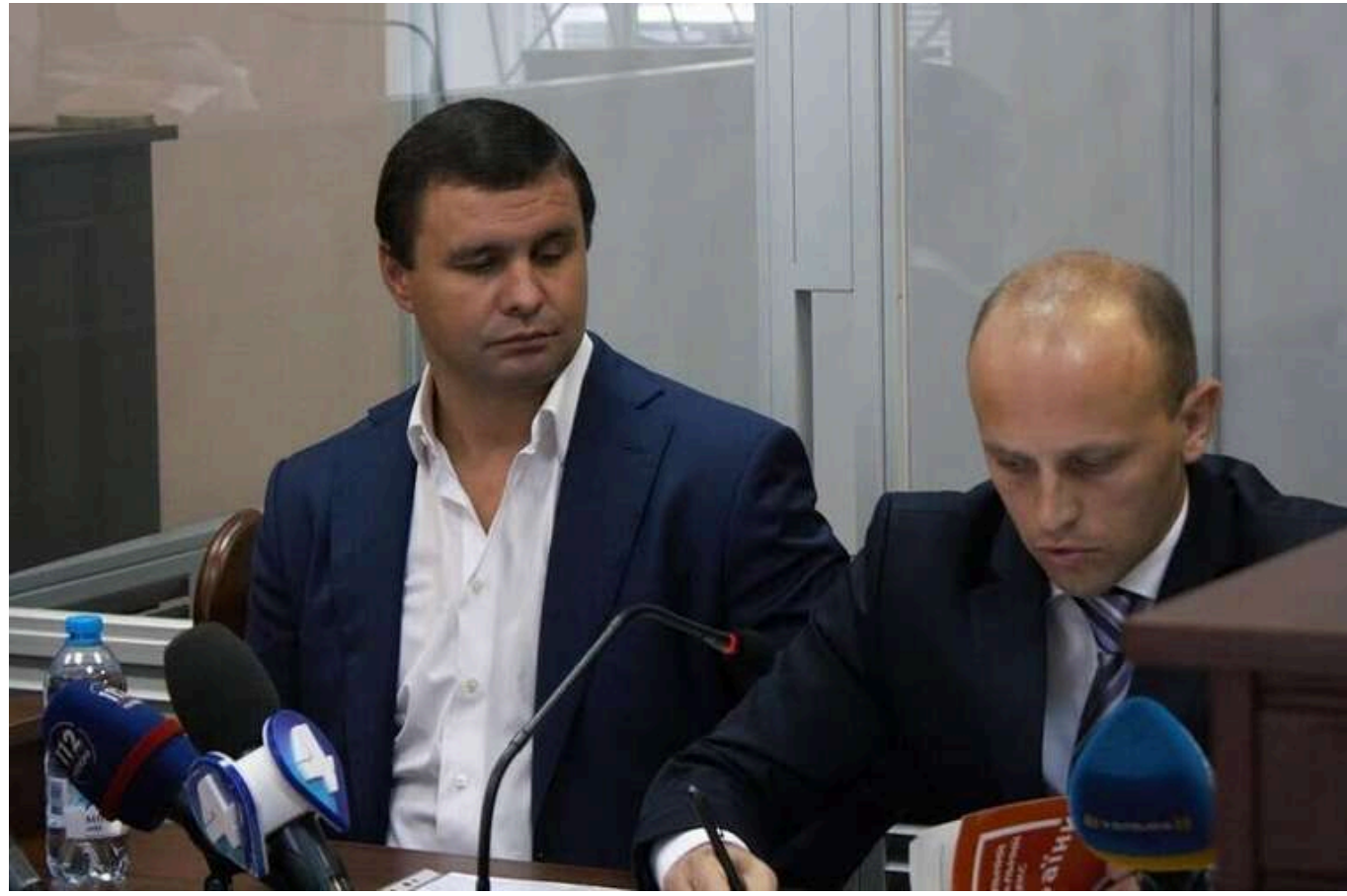
Екснардепу Микитасю зняли електронний браслет, але продовжили запобіжний захід у справі про розкрадання коштів

Читати на руском Read in English Додати як бажане джерело в Google