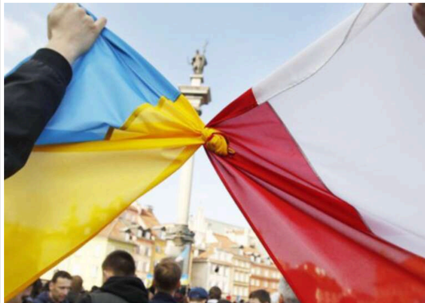
Київ розраховує на незмінну підтримку Польщі за президентства Кароля Навроцького

Київ сподівається, що політика офіційної Варшави залишиться незмінною щодо підтримки України за президентства Кароля Навроцького, адже безпека двох держав тісно пов'язана.