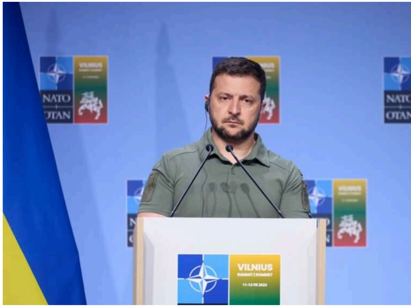
Зеленський отримав запрошення на саміти НАТО і G7, але ще не підтвердив участь

Президент України Володимир Зеленський отримав запрошення на майбутні саміти НАТО, Європейського Союзу та Групи семи (G7). Однак його участь у цих заходах ще не підтверджена.