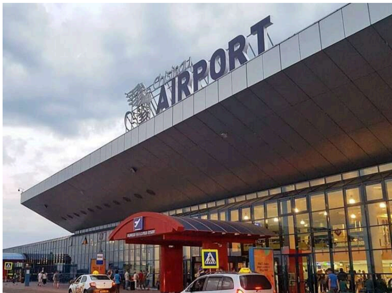
В аеропорту Кишинєва стався збій через атаку РФ на Україну

Міністр інфраструктури Молдови Володимир Боля повідомив, що збій, який стався в понеділок, 9 червня, в аеропорту Кишинєва, був наслідком російської атаки по Україні.