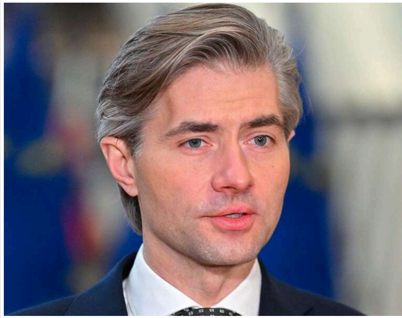
Глава МЗС Литви обурений масованою атакою РФ на Київ і Одесу: "Путін не прагне до припинення війни"

Міністр закордонних справ Литви Кястутіс Будріс висловив обурення у відповідь на масовану атаку РФ, внаслідок якої під ударом опинилися Київ і Одеса.