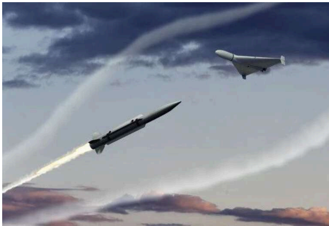
Масовані атаки РФ – сигнал слабкості Заходу та передвісник великої війни в Європі, - Коваленко

Читати на руськом Read in English Додати як бажане джерело в Google