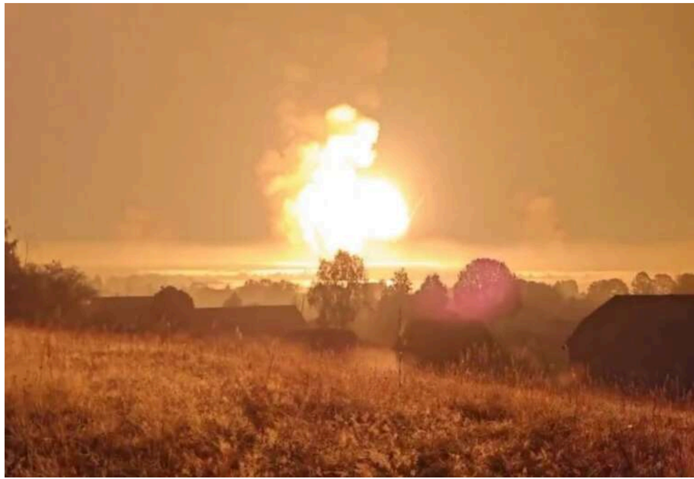
Україна різко посилила удари по штабах РФ: ймовірно, залучена власна балістична зброя, – експерт

На початку травня Збройні сили України суттєво збільшили кількість успішних ударів по командних пунктах російських військ, що свідчить про розширення арсеналу засобів ураження.