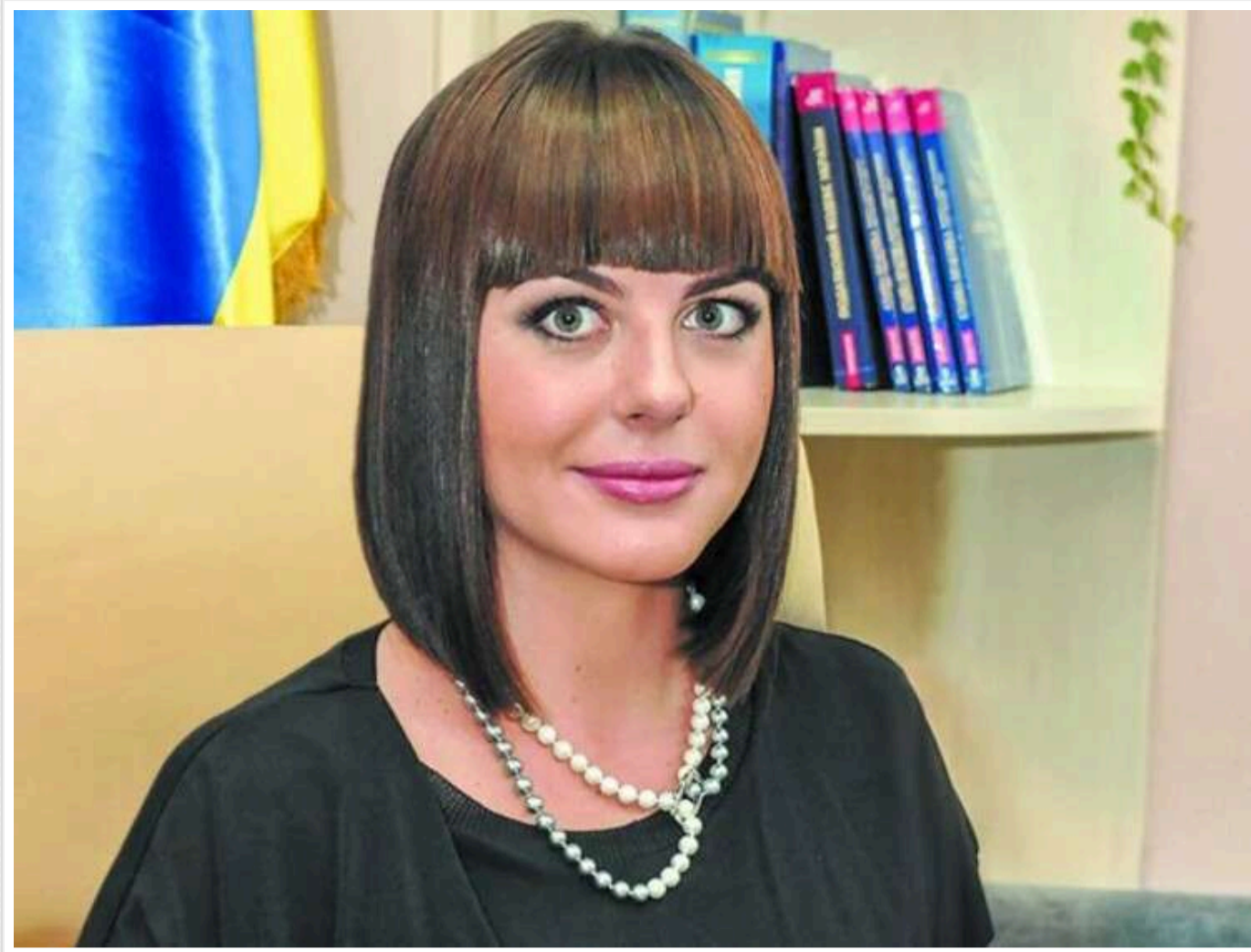
Суддя Окружного адмінсуду Києва Клочкова у 2024 році придбала BMW, орендувала квартиру та зберігає сотні тисяч гривень готівкою

Читати на руському Read in English Додати як бажане джерело в Google