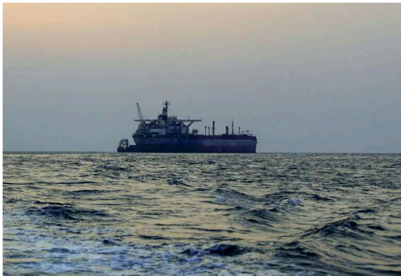
Японія вперше за два роки імпортувала російську нафту з санкційного танкера

Японська нафтопереробна компанія Taiyo Oil Co. отримала 600 тисяч барелів сирої нафти Sakhalin Blend із танкера Voyager, який перебуває у санкційних списках США та ЄС.