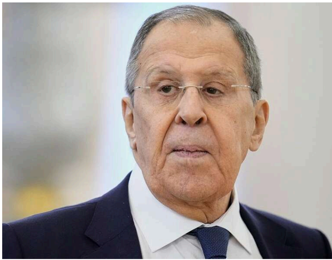
Лавров запропонував перенести штаб-квартиру ООН до Сочі

Міністр закордонних справ Росії Сергій Лавров висловив думку, що Організація Об'єднаних Націй мала б розташуватися у російському місті Сочі.