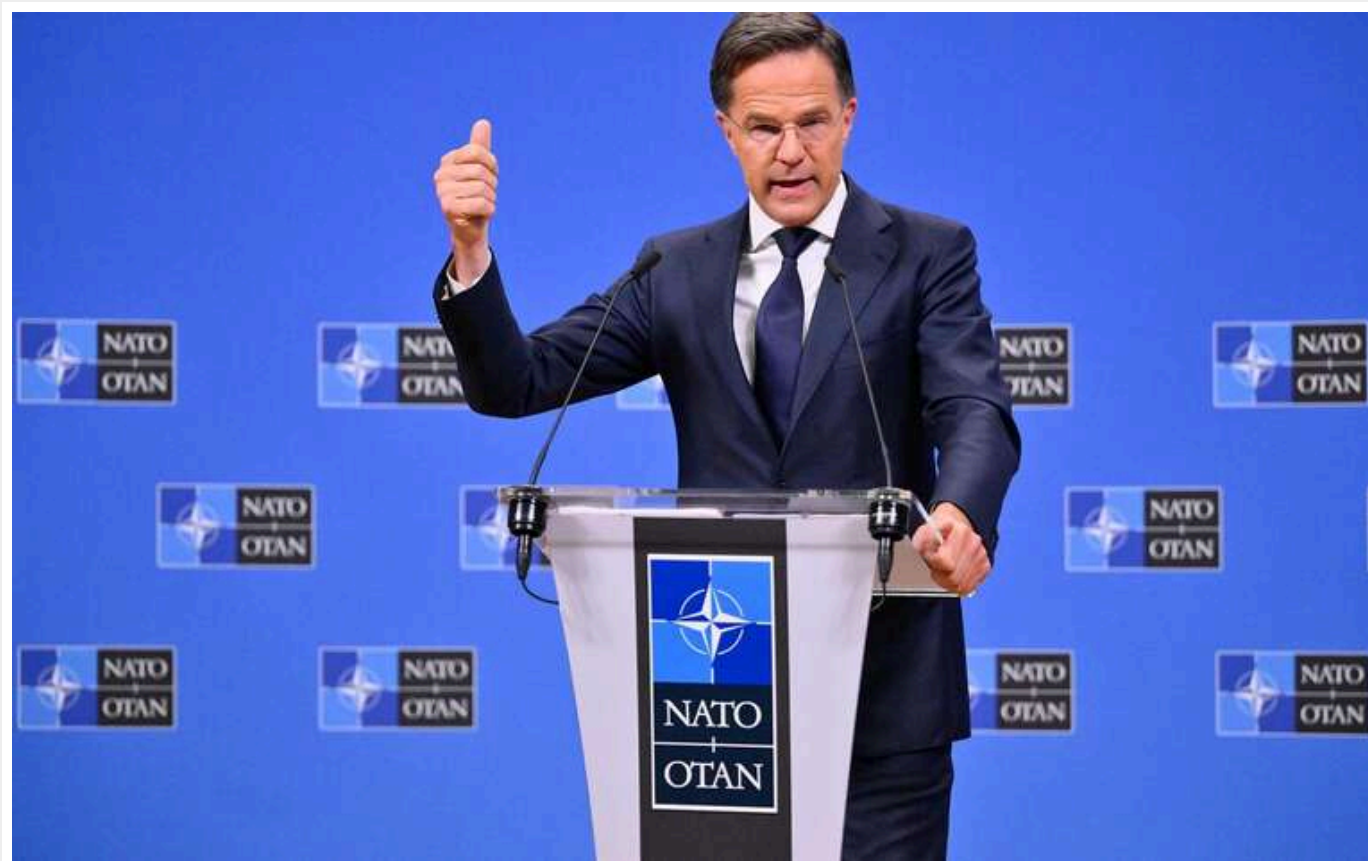
РФ може здійснити напад на НАТО протягом п'яти років, - Рютте

Читати на руськом Додати як безпечне джерело в Google