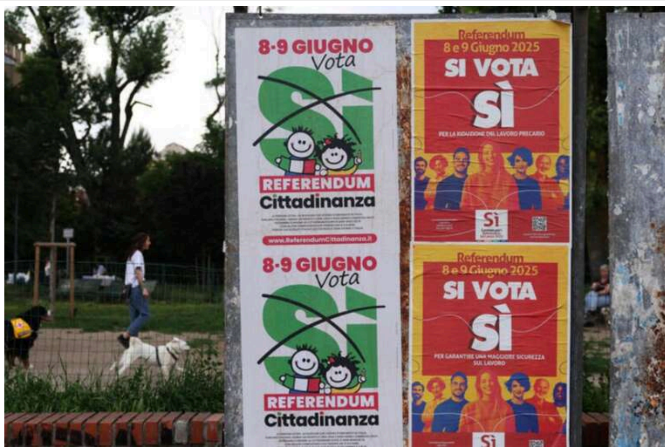
В Італії референдум з питань громадянства зазнав невдачі через низьку явку

В Італії завершився дводенний референдум, на якому громадяни повинні були розв'язувати питання про полегшення процедури отримання громадянства та перегляд трудової реформи.