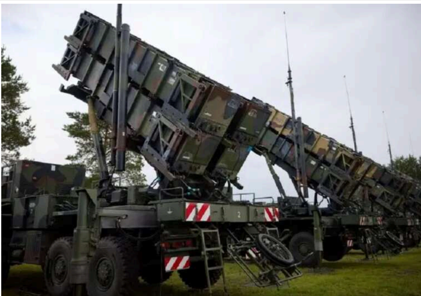
Під час можливої ракетної атаки РФ на Німеччину пріоритети захисту визначатиме не Берлін і навіть не Бундесвер - NZZ

Вже декілька місяців над промисловими об'єктами, вітровими електростанціями, військовими частинами та портами Німеччини з'являються невідомі безпілотники. Вони пролітають, знімають на відео та зникають. В Німеччині підозрюють, що це справа рук російських спецслужб. При цьому влада може мало що зробити, щоб їх зупинити. Але безпілотники - це не найстрашніше, що може загрозувати Німеччині з повітря. Надзвичайна ситуація має інший вигляд. Вона полягатиме у тому, що Росія почне атакувати не тільки Україну, але й цілі на території країни - за допомогою балістичних та крилатих ракет, а також гіперзвукової зброї.