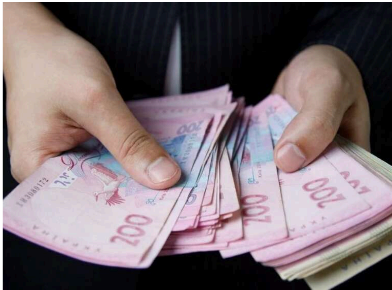
Тимчасовий директор держпідприємства НААН підозрюється у привласненні 450 тисяч гривень через фіктивні виплати

Читати на руском Read in English Додати як бажане джерело в Google