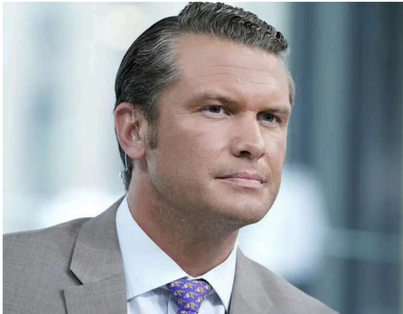
Трамп не може знайти кваліфікованих людей, які готові працювати на Гегсета, - ЗМІ

Білий дім шукає нового керівника апарату та кількох старших радників для глави Пентагону Піта Гегсета після низки промахів, але поки що не може знайти гідних кандидатів.