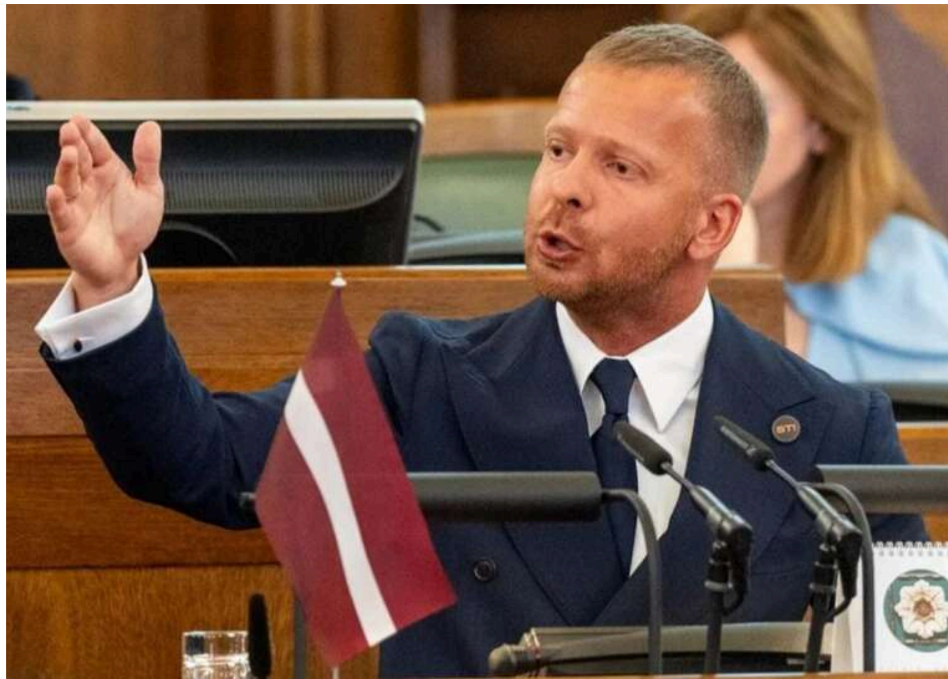
У Латвії відкрили справу проти скандального проросійського депутата

Служба державної безпеки (СДБ) Латвії порушила проти депутата Сейму Олексія Рослікова кримінальну справу за надання допомоги державі-агресору (Росії) та за розпалювання національної ворожнечі та ненависті.