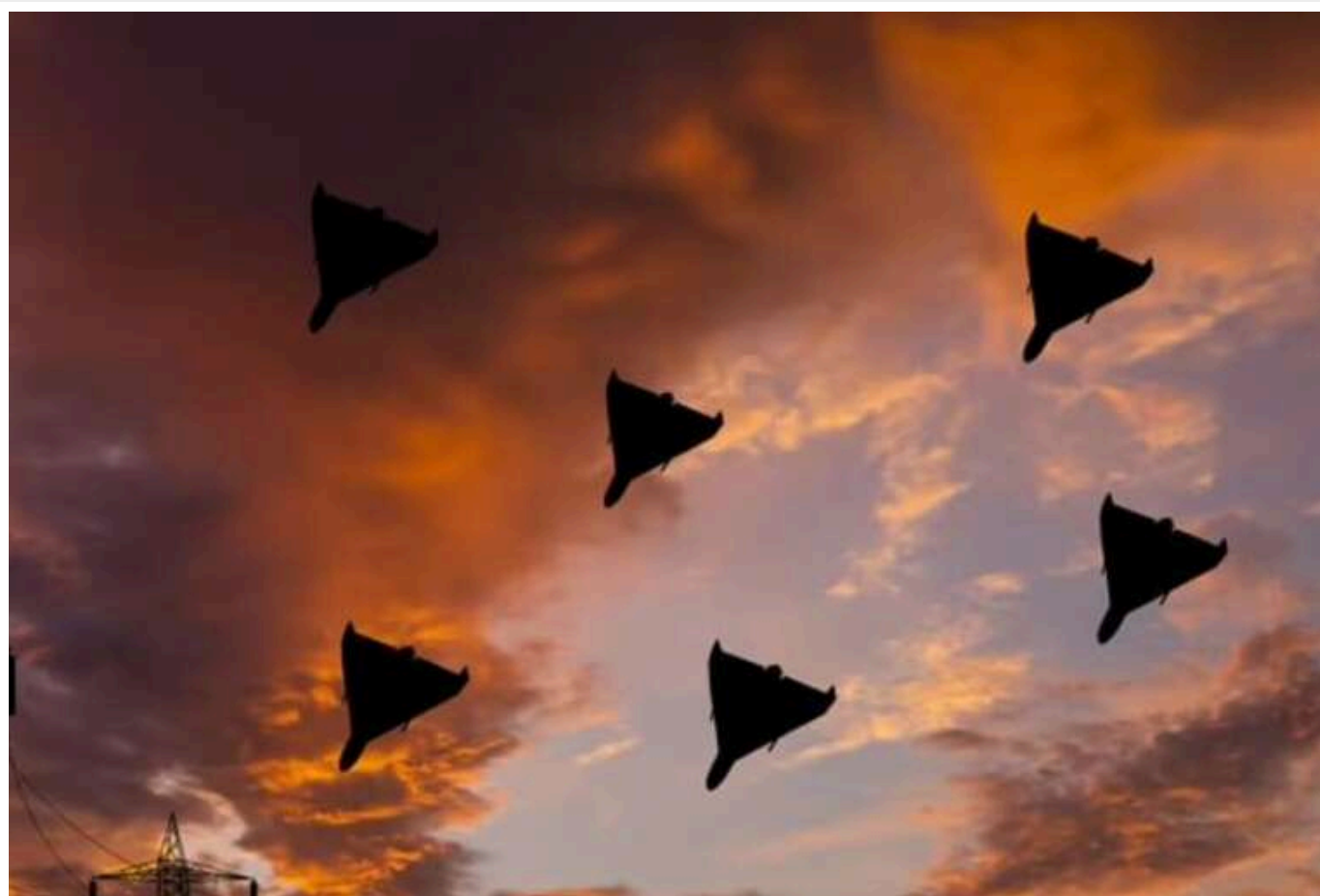
РФ збільшила вп'ятеро виробництво «шахедів» - до 2700 дронів на місяць, - ГУР

Росія протягом року суттєво наростила виробництво ударних дронів типу "Шахед" – до 2700 одиниць на місяць, повідомляє Головне управління розвідки Міноборони України. Це стільки ж – це імітаційні безпілотники, які застосовуються для введення в оману української ППО.