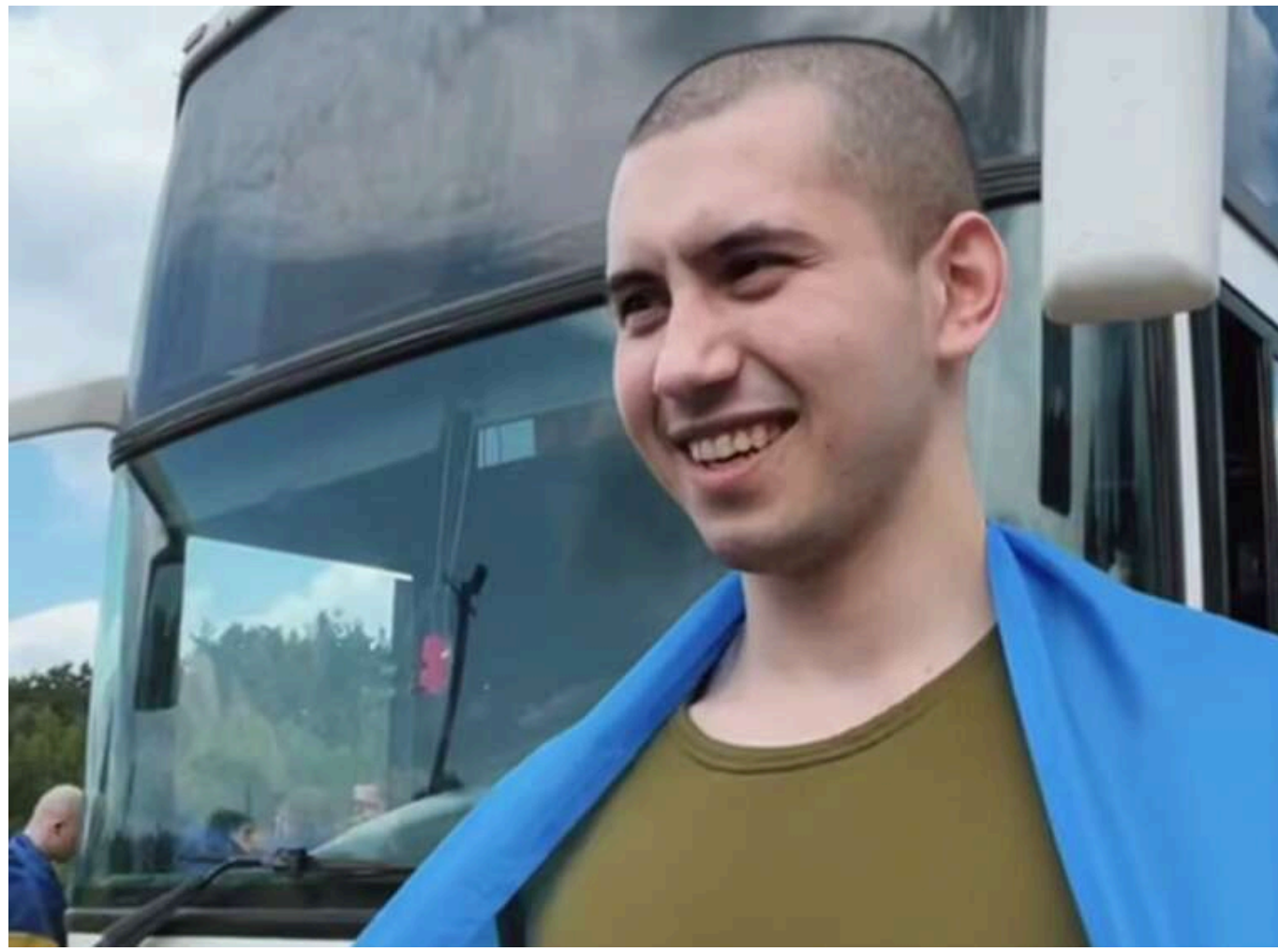
«Мамо, я вдома! Спасибі, що ти є», - перший дзвінок після обміну

"Мама - найдорожче, що в мене є. Дякую, що ти є": омбудсмен оприлюднив кадри першого дзвінка звільненого українського захисника з полону.