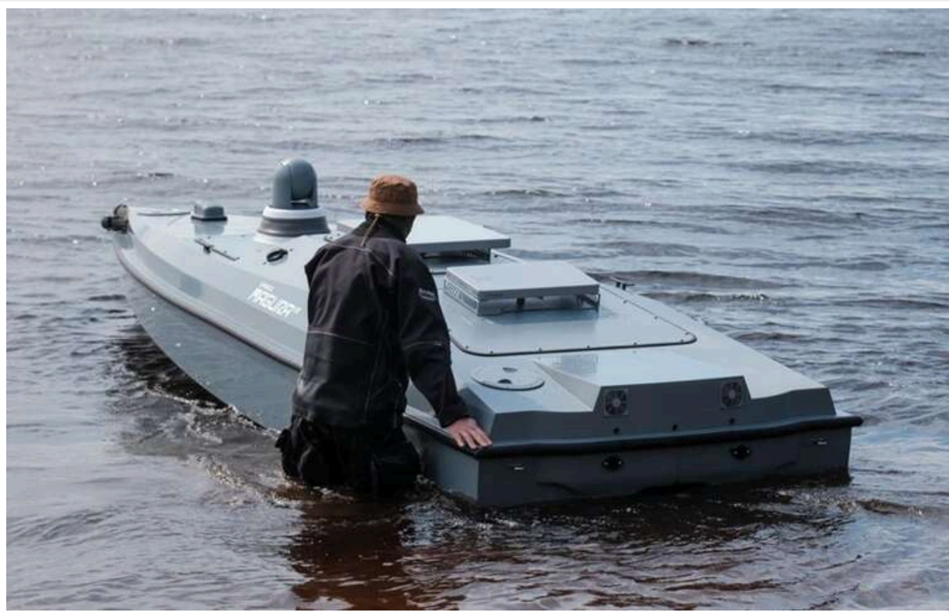
У ГУР показали, чим зупиняють удари по Україні: «Ці дрони являють собою майбутнє»

За останні три роки Україна досягла значного технологічного прориву в галузі безпілотних бойових систем. Одним з найновітніших здобутків став багатопільовий морський дрон Magura V7, який реалізує нову стратегію ведення війни на воді. У травні він взяв участь у унікальній бойовій операції.