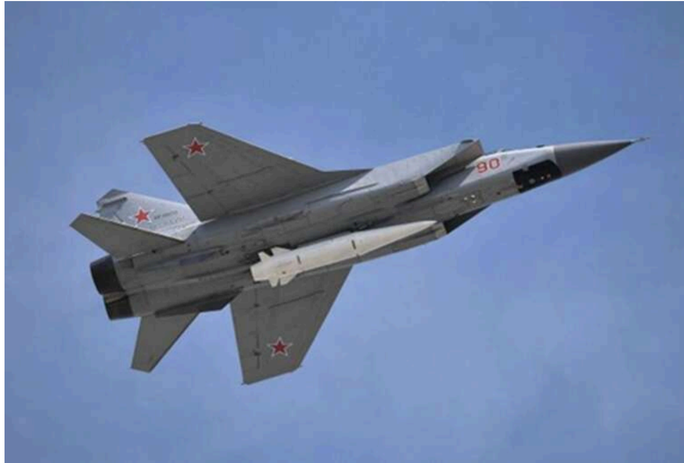
Генштаб: На аеродромі "Саваслейка" уражено літаки РФ, ймовірно, МіГ-31 та Су-30/34

Читати на руськом Read in English Додати як бажане джерело в Google