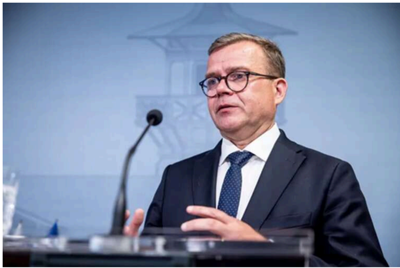
Фінляндія готується до загрози з боку РФ: витрати на оборону зростуть до 3% ВВП

Фінляндія вимушена посилювати свою оборону через загрозу з боку Росії. Прем'єр-міністр Петтері Орпо заявив, що оборонні витрати щороку збільшуватимуться на мільярди євро.