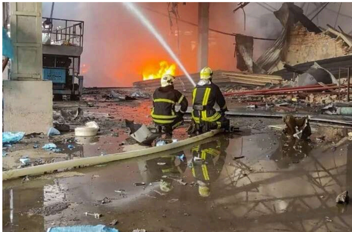
Наслідки атаки ворожих "шахедів" на Київ: шестеро постраждалих досі у важкому стані

Через дві доби після масованої дронавої атаки військ РФ на Київ, яка відбулася 6 червня, в лікарнях залишаються 18 постраждалих. Шестеро з них – досі у важкому стані.