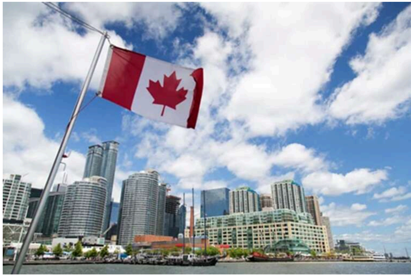
Канада продовжила пільговий режим для імпорту українських товарів

Канада продовжила безмитний режим для українських товарів до 2026 року.